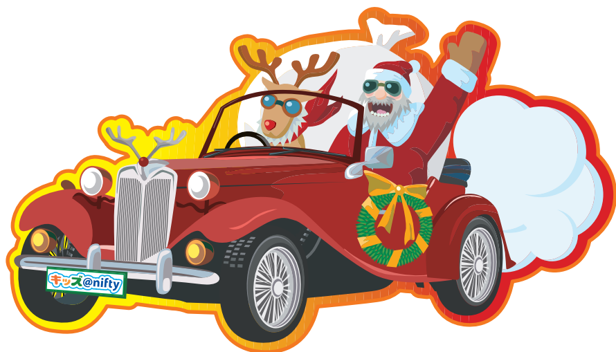
サンタさんとトナカイ